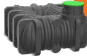
ZA ODPADNO VODO