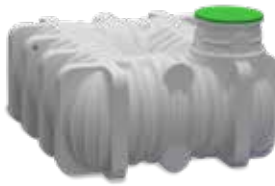
ZA PITNO VODO