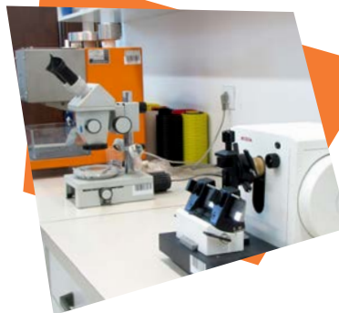
Lastna kontrola kakovosti