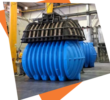
Proizvodnja PE izdelkov s postopkom rotoliva.